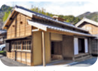
花沢地区 ビジターセンター