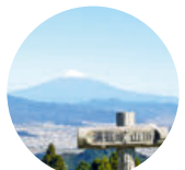
山頂からの富士山絶景